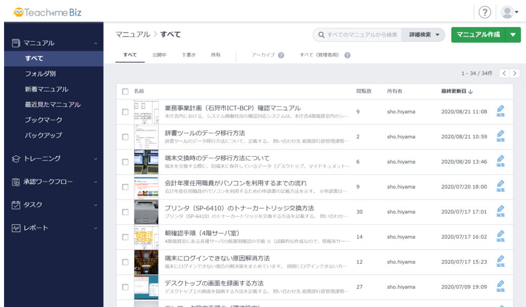
石狩市役所で活用されている手順書

石狩市では、市民が様々な手続きや申請をする際、申請書等の記入例を紙で用意し、手渡ししたり郵送したりしています。2021年以降は、紙の記入例とあわせてTeachme Bizでも手順書を作成し、スマートフォンを所有する市民はQRコードから手順書にアクセスできるようにすることで、ペーパーレスおよび行政サービスにおける利便性の向上を目指します。