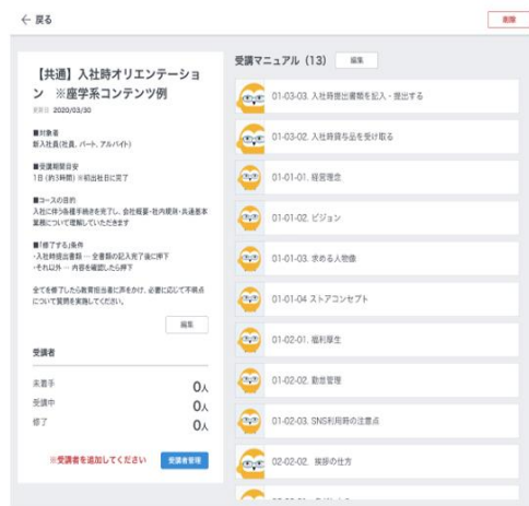
トレーニング機能の画面

また「Teachme Biz」は、いつでもどこからでもコンテンツにアクセスができるため、空き時間に研修内容を把握して予習に取り組めることや、学習の進捗状況が可視化される特性上、反転学習* 2 が捗る環境が整っています。さらに、教育担当者が全員の受講状況をリアルタイムで把握ができるため、それぞれの進捗に応じたきめ細やかなコミュニケーションを取ることが可能となりました。これによって、入社間もないことから緊張し、加えて集合研修と比較するとコミュニケーションの取りづらいオンライン環境においても、新入社員の習熟度の向上につながりました。