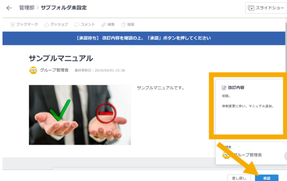
画像：承認ワークフロー機能の操作画面